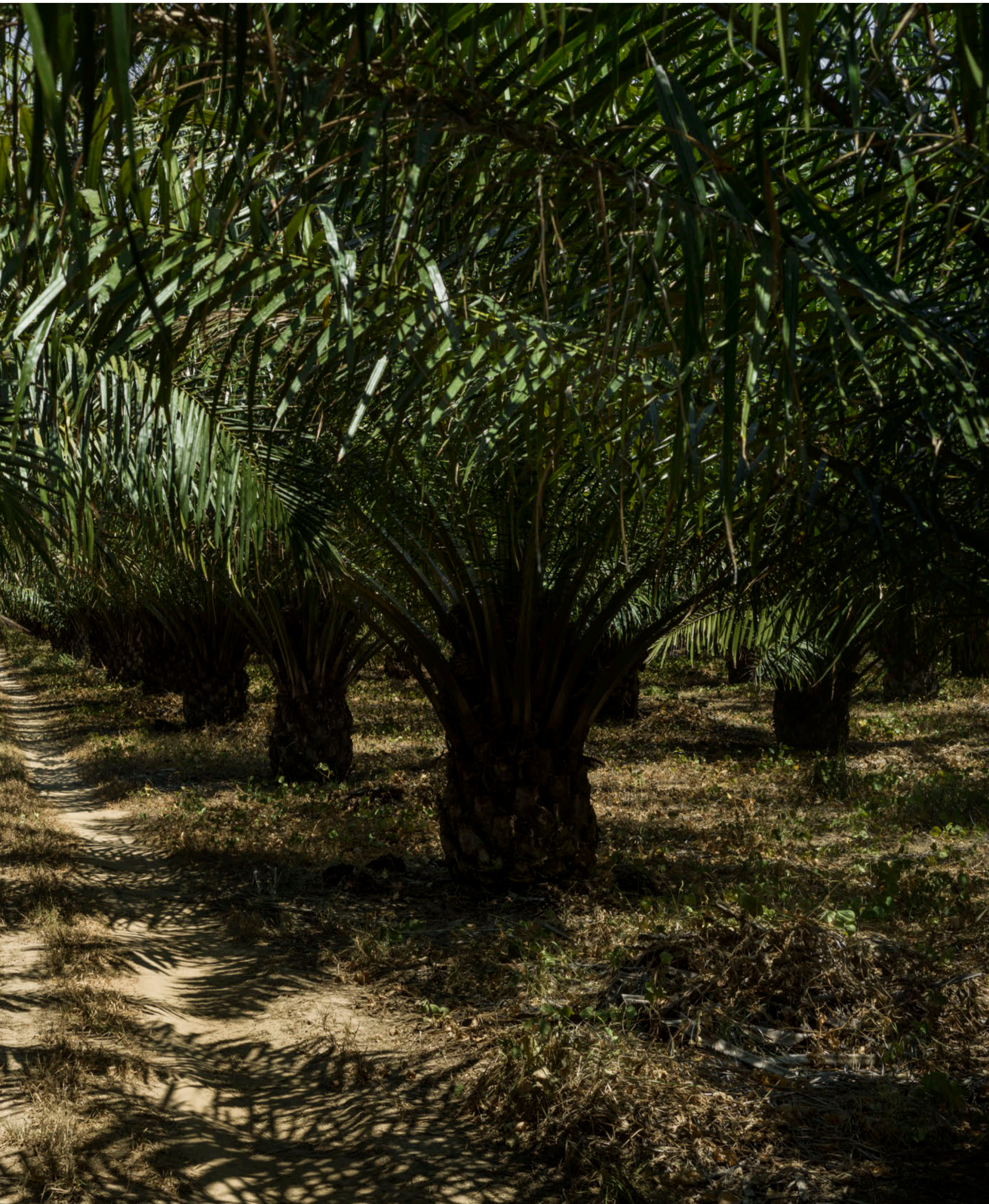
. Til gengæld kan man så høste palmefrugterne de næste 20 år. Og længere endnu, hvis ikke det var, fordi de derefter har vokset sig så høje, at det er for besværligt at høste frugten.