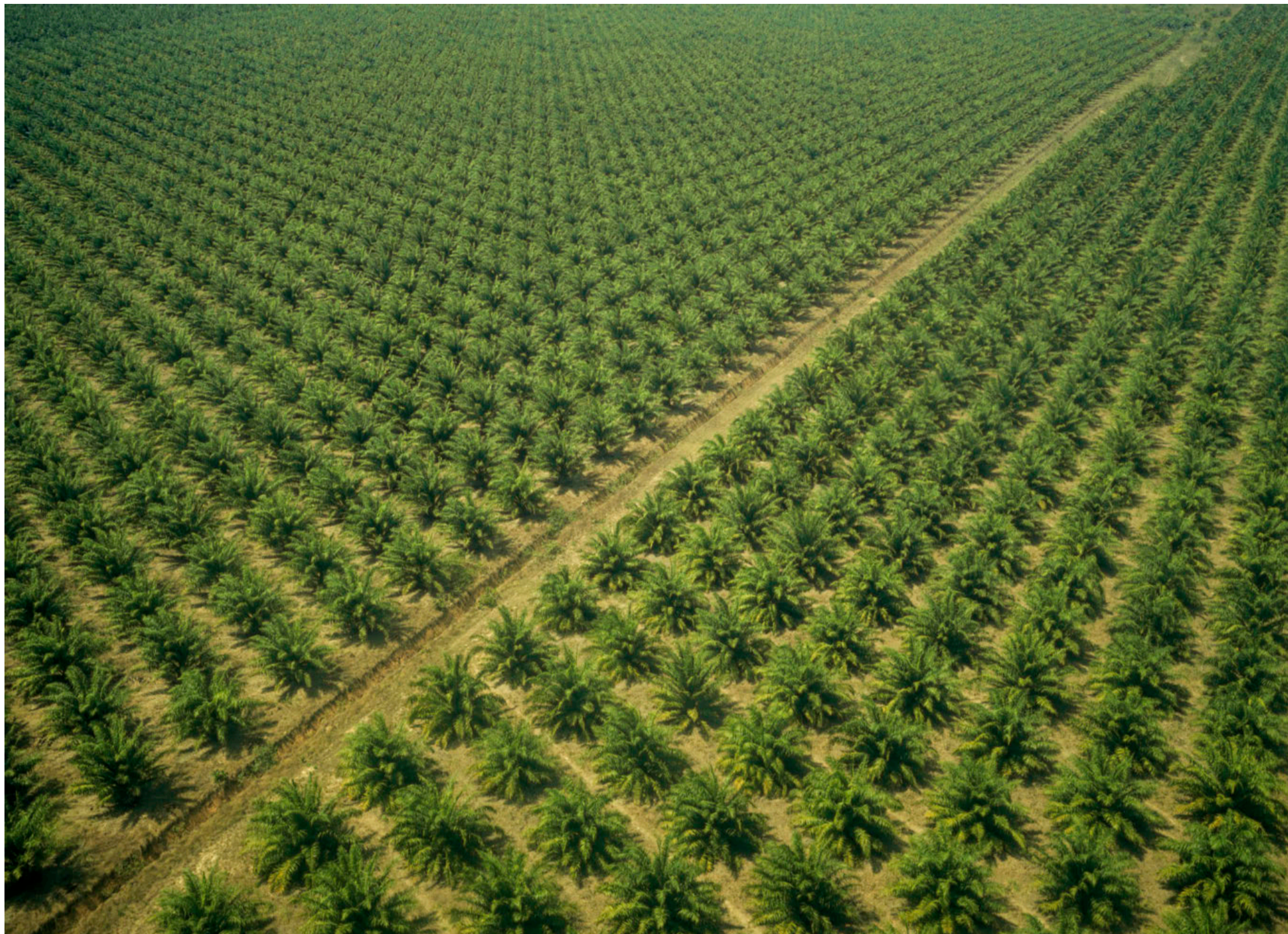
LANDSKABET. Los Llanos-sletten er flad som en pandekage. Det ideelle sted at dyrke oliepalmer, hvis man ikke bryder sig om at udrydde regnskov og dyrearter.